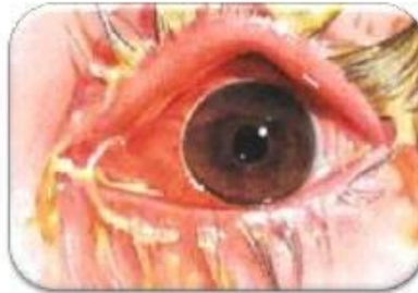
Casos > graves • Mucopurulenta