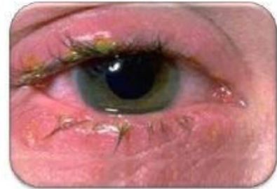
Secreción en la noche • Seca sobre párpados • Impide abrirlos ojos